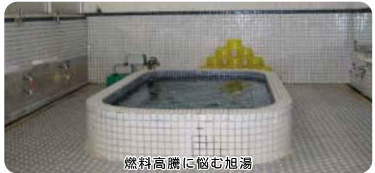
燃料高騰に悩む旭湯

町長 ふるさと納税制度はふるさとに対し貢献したい、応援したいという思いを寄附金という形にしたもの。寄附をされた方の善意に応えるためにも有効な使い方を考えなければならぬ。地域活性化、少子化対策、文化・スポーツ、観光、地場産業育成などのメニュー