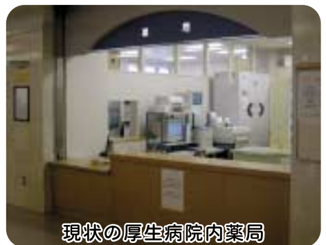
現状の厚生病院内薬局

町長 名寄市等の医療機関に通院されている方々の薬の待ち時間の解決策として、厚生病院に院外薬局経営ということであるが、旭川厚生病院もそうであるが厚生連は、現在院外薬局はやっていないと聞く。厚生連と相談する機会を見つければ、このような考え方を