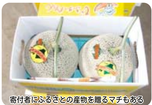
寄付者にふるさとの産物を贈るマチもある

受けながら、既存町道の改良や騒音対策等財政的なこともあると思うが、お願いすることをしながら進めて行きたい。