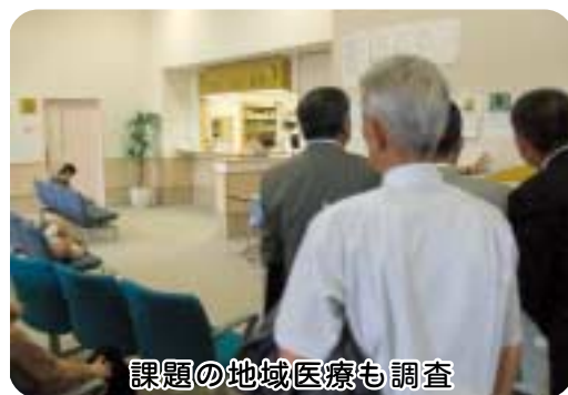
課題の地域医療も調査