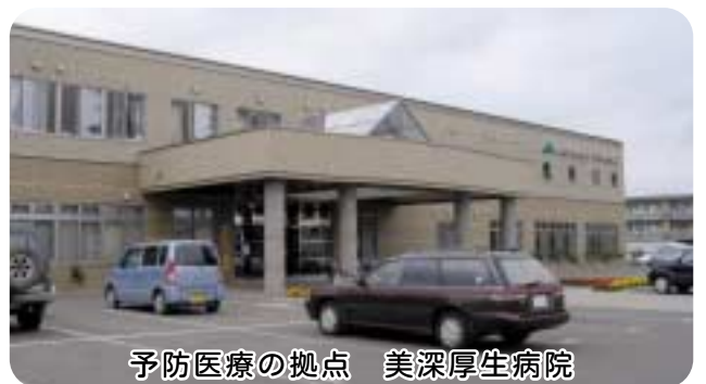
予防医療の拠点 美深厚生病院