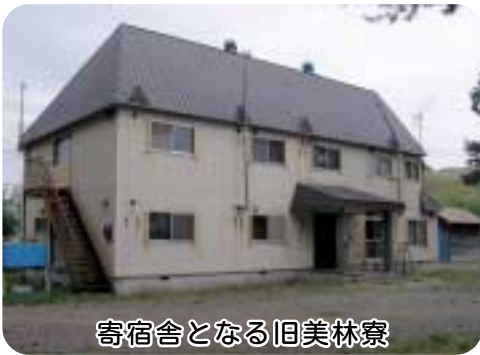
寄宿舍となる旧美林寮