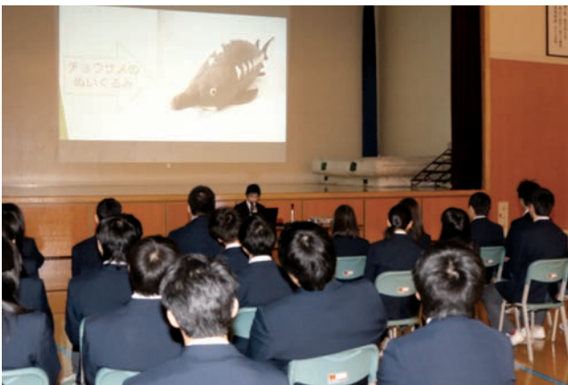
「チョウザメ」商品の開発を提案する生徒