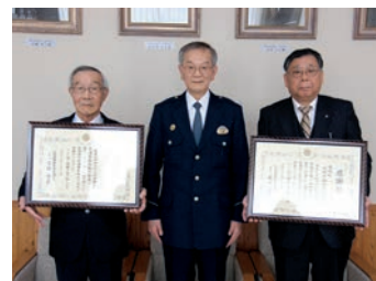
感謝状を受ける山口会長(右)と中林会長(左)