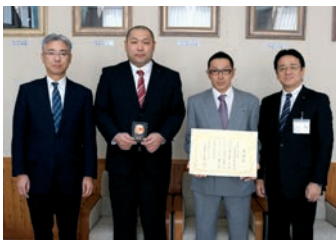
受賞した菅野部長(中央右)、小野寺副部长(中央左)