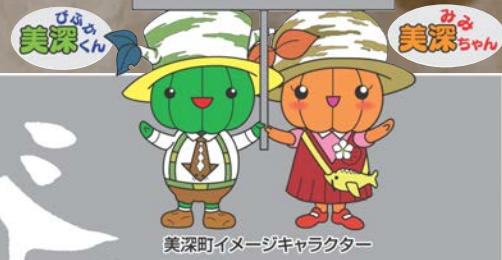
美深町イメージキャラクター