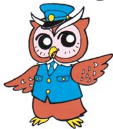
「ミマモロウ」 美深警察署 オリジナルキャラクター