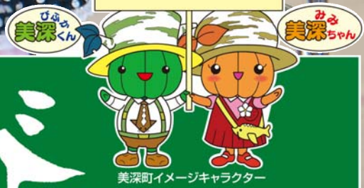
美深町イメージキャラクター