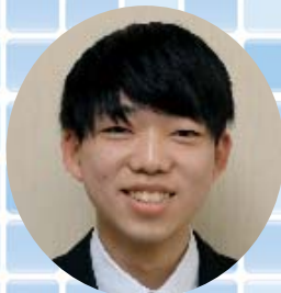
主事補 會見 大地 (住民生活課生活環境グループ)