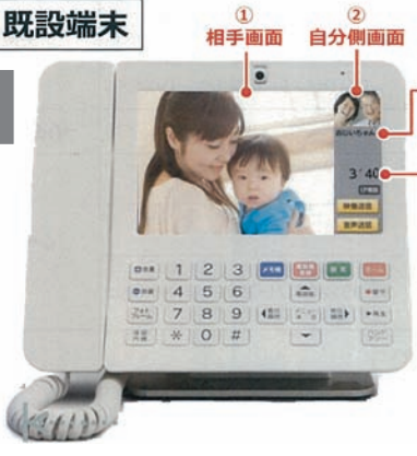
① 相手画面 ② 自分側画面