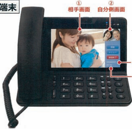
① 相手画面 ② 自分側画面