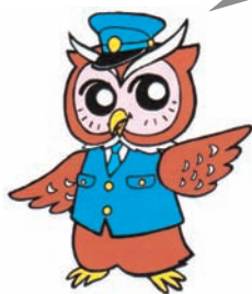
「ミマモロウ」 美深警察署 オリジナルキャラクター