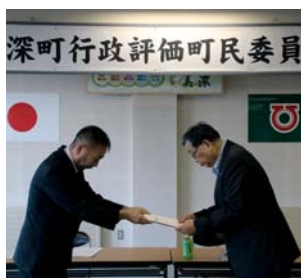
齊藤委員長(左)から町長へ報告書が手渡されました