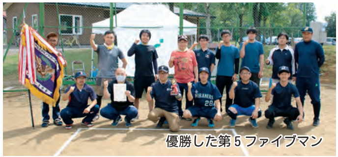
優勝した第5ファイブマン