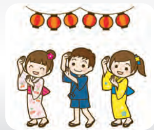
美深ふるさと 子ども盆踊り 8月13日

・風疹にかかったことがある方 ・平成26年4月1日以降に受けた風疹抗体検査により十分に抗体を保有して