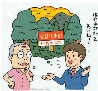
媒介手数料を先に払って...

「数十年前に購入した遠方の土地を売いませんか」と電話が入り、自宅に来ることを了承した。「この土地は270万円から売り出します」と言われて土地の宣伝や広告費用、土地の調査費用、資料の作成、資産管理費などに33万円の費用が掛かると説明を受けた。よく理解できぬままに、不動産業務委託契約書にサインをした。知人の不動産業者に聞くと、土地を売るのにお金を払う契約はおかしいと言われた。まだお金は支払っていない。解約したいので手順を教えてください。(60代 男性)