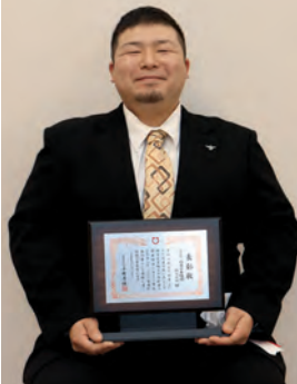
株式会社 はちみつ西垂水養蜂園

敬老の祝い品として75歳以上の全ての町民に蜂蜜をご寄贈され、高齢者の健康増進に大きく寄与されました。