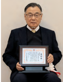
株式会社 三洋コンサルタント

活気に満ちたまちづくりを目的として、3度にわたりご寄付をされ、本町の発展に大きく貢献されました。