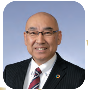
美深町長 草野孝治