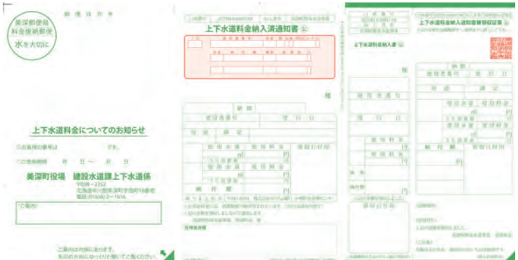
納付書見本 (三つ折りの圧着ハガキ)

調定月の6・9・12・3月にそれぞれ3カ月分(3枚)の納付書が郵送されますので、ご注意ください。