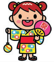
美深ふるさと夏まつり 7月24～25日