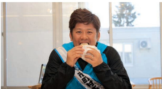
稲田さん大絶賛「びふかWバーガー」