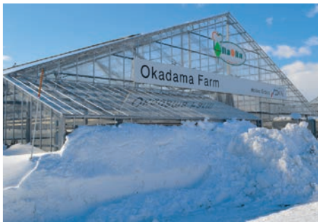
アド・ワン・ファームのハウス

このグループ企業では、園芸資材を道内で生産流通させているため、資材を安価に提供できること、生産だけでなく流通まで責任を持つことで、新規就農者でも安心して生産に専念できる体制作りをしているという事でした。