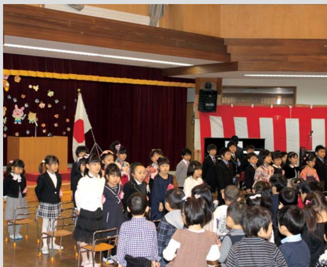
幼児センター卒園式 (3月16日)