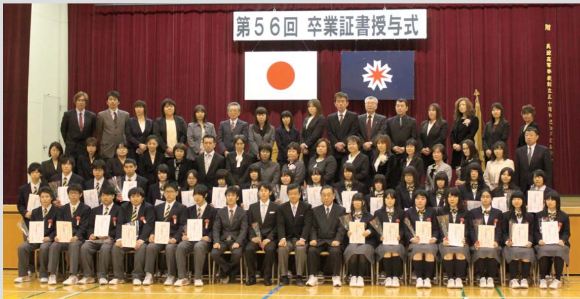
第56回美深高等学校 卒業証書授与式