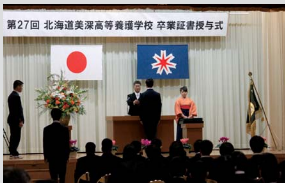
第27回 北海道美深高等養護学校 卒業証書授与式