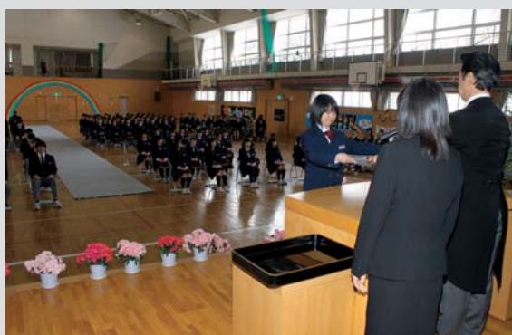
第66回美深中学校 卒業証書授与式 (3月14日)

思い出の詰まった学舎(まなびや)を巣立つ児童や生徒たちは、新たな一歩を踏み出しました。