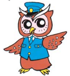
「ミマモロウ」 美深警察署 オリジナルキャラクター