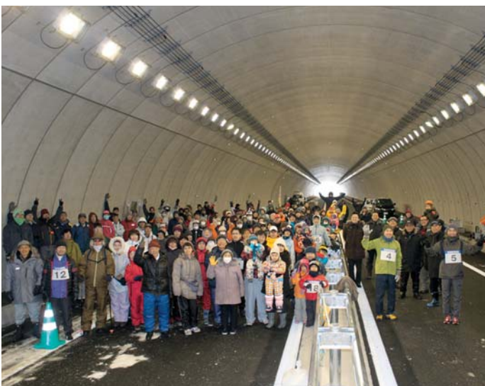
美深菊丘トンネルの中で記念撮影