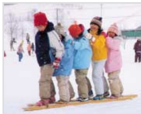
▲雪中むかで競走ではなかなか前に進まないチームも