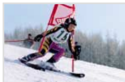
▲第30回ジュニアアルペンスキー大会では小中学生39人が出場