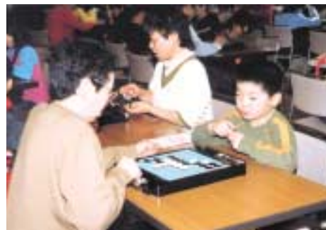
▲トーナメント戦も行われたオセロ大会