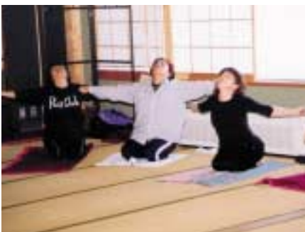
▲3月24日まで全5日の日程でヨーガの基本を学びます

肉が伸びた感じがします。無理な運動ではないので気持ち良く、長く続けられそうですね。」と話してくれました。