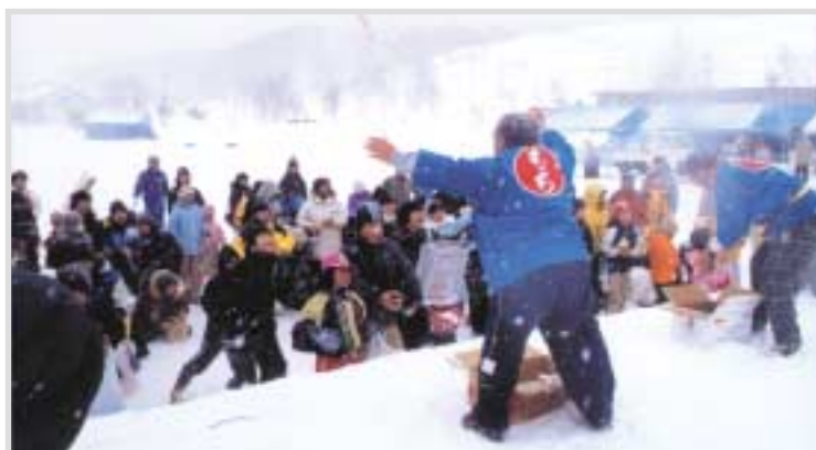
▲イベントの最後には、もちまきが行われました