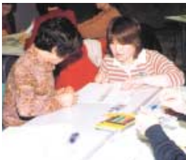
▲講師のアドバイスを受けながらデザイン画を作成する参加者

く、他の参加者が考えたデザインもとても勉強になりました。今年の花壇コンクールに向けてさらに知恵をしばって取り組んでいきたい。」と話してくれました。