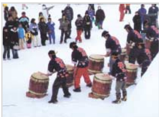
▲寒さもふきとばす北斗太鼓の力強い演奏