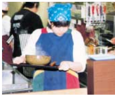
▶食堂での実習で真剣に取り組む生徒