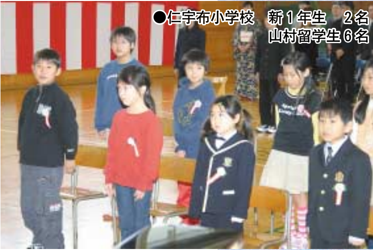
●仁宇布小学校 新1年生 2名 山村留学生6名