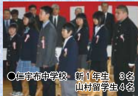
○仁宇布中学校 新1年生 3名 山村留学生4名