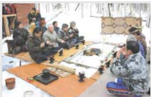
▲森の神様に感謝「カムイノミ」

今年は国際樹液サミットが同時開催されたこともあり、道内外から多くの人々が訪れ、樹液採取体験などを楽しみながら自然の恵みいっぱいの「春の樹液」を堪能しました。