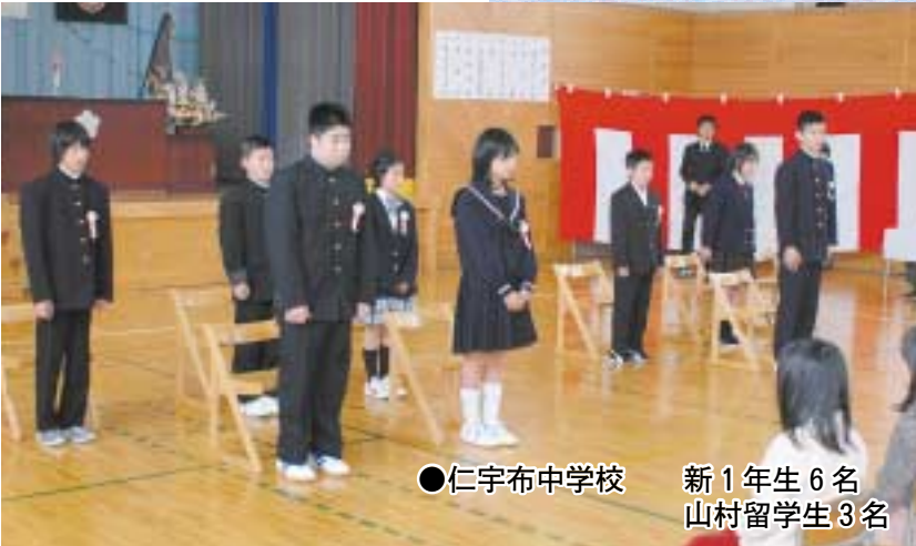
●仁宇布中学校 新1年生6名 山村留学生3名