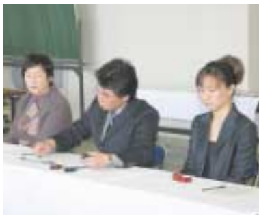
▲協定書にサインした調印式

対し「家族一丸で困難に立ち向かうため、今協定を有意義なものにしたい。」と誓いの言葉を述べ、今後の農業経営に向けて、意欲を示しました。