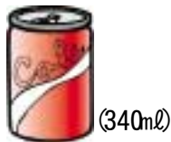
炭酸飲料 36g (340ml)