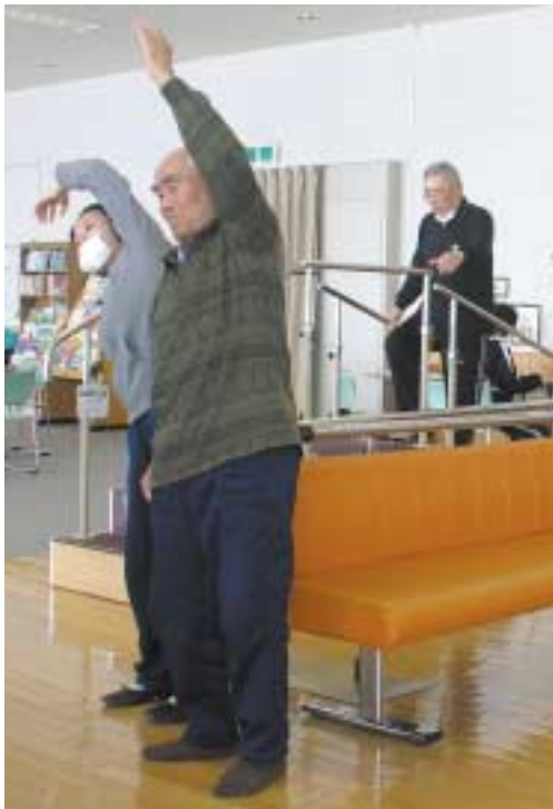
▲運動機能向上教室でリハビリに励む高齢者