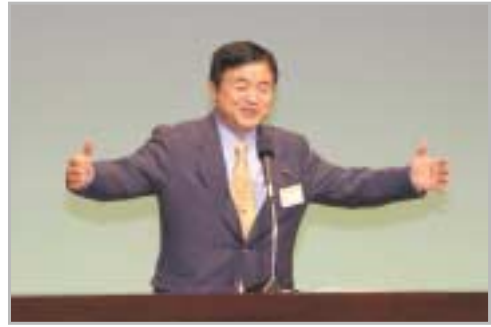
▲激励に訪れた文科省の遠藤利明副大臣