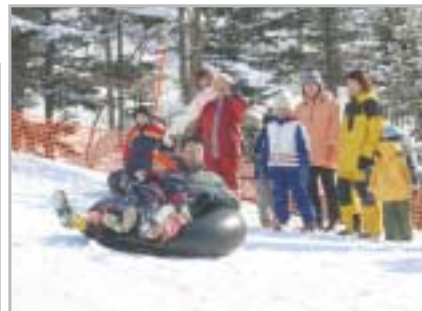
◀親子チューブカーリングは、子どもよりも親の方が真剣です。