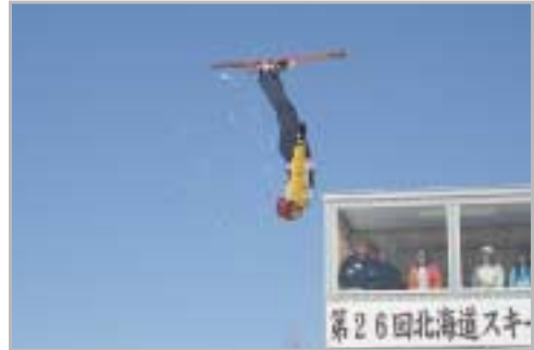
▲トップアスリートたちによる華麗な演技の数々は観客たちを魅了していました