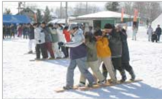
◀冬まつりといえば、雪中むかで競走。息をあわせて、イチ、ニ、イチ、ニ。