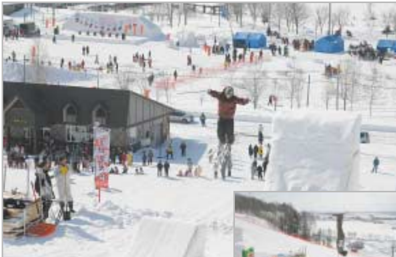
▲▶宙返りなど華麗な技を披露したエアリアルの公式練習。