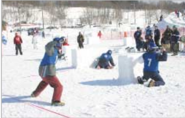
▲今年も熱戦が繰り広げられた雪合戦大会。男子の部、少年の部あわせて8チームが参加しました