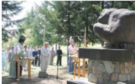
▲林業や山の仕事の安全を祈念した樹霊祭 (5/31)

子どもからお年寄りまでたくさんの方々が参加して行われた各植樹祭。参加者たちは、木々の成長を願って一本一本丁寧に苗木を植えていました。