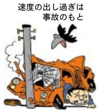
は出し過ぎは速度の事故のもと

制動距離も長くなるのでブレーキを掛けても止まらずに交通事故となることが多くなります。速度を控えた安全運転をしましょう。