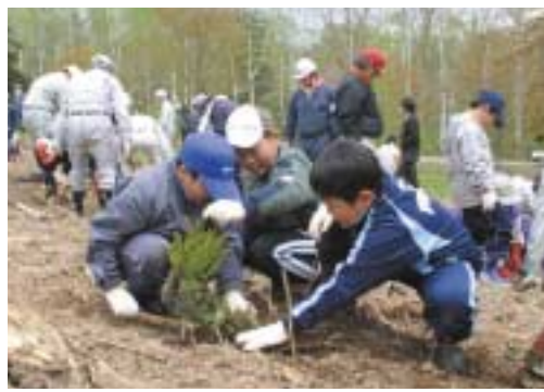
▲協力して植樹する美深小学校の児童 (5/24)

Mカレッジ110美深大学美深校の学生など約90人が参加して、アカエゾマツ90本、シラカバ100本など計234本の苗木が植樹されました。