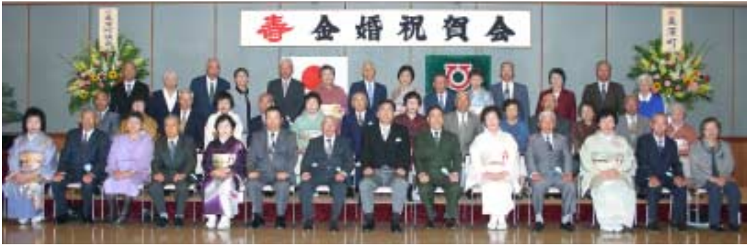
▶祝賀会には、21組41人のご夫婦が出席されました。

結婚50年を祝う町主催の金婚祝賀会が6月7日文化会館COM100を会場に行われました。