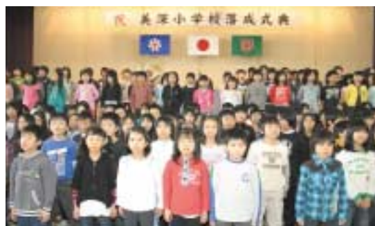
▲全児童による校歌斉唱も行われた落成式典