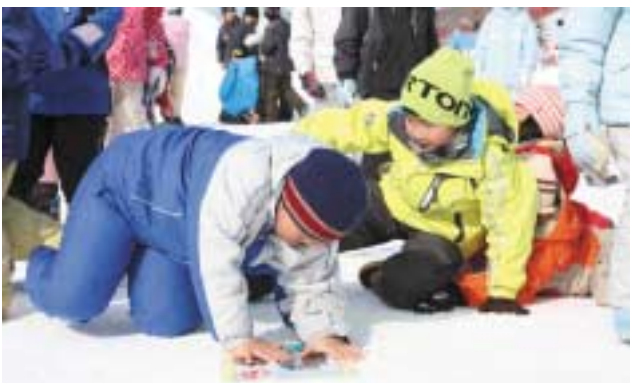
▲札に向かってダッシュ！新イベント「雪中かると取りゲーム」

また、同じ日、同社は美深警察署において身近な生活犯罪情報などを配信する「防犯ほっとインフォメーション」の運用に関する協定を締結、美深警察署内に電光掲示板付き自動販売機を1台設置しました。