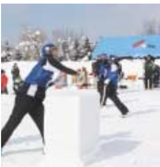
▲恒例の雪合戦や滑り台などで雪と親しむ参加者

「びふかウィンターフェスタ'10」が2月21日、運動広場とスキー場を会場に行われました。この日は天気も良く、スキー場ではアルペンスキー大会が行われたほか、運動広場では、多くの町民が冬ならではのイベントを楽しんでいました。