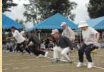
▲風船を割る「血圧測定」