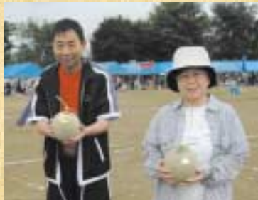
▲抽選会でメロンをゲット！