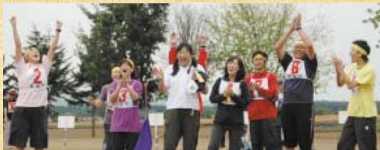
見事優勝を果たしたのは第4町内会のみなさんでした！