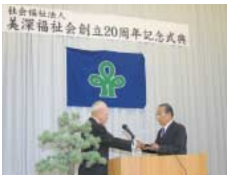
▲功労者への表彰も行われた記念式典

また、法律の改正により、従来の施設入所型から地域移行型へと転換してからは、グループホームとケアホームの一体型共同生活介護・共同生活援助事業所を町内各所に開設し、本年5月には「美深のぞみ学園」の施設利用者の地域移行を完了。平成20年9月1日には、