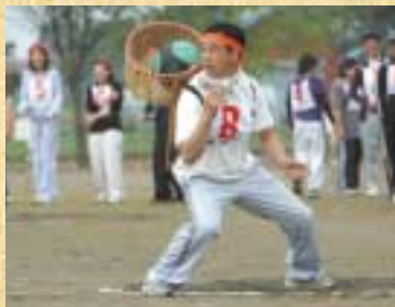
▲カゴでキャッチ「天国と地獄」