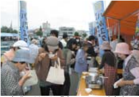
▲大盛況だった「麦チェン」試食会

美深産小麦で作ったラーメンとパンの試食会が、9月4日、美深ふるさと秋まつりの会場で行われ、たくさんの方で賑わいをみせていました。