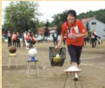
▲新競技「カゴリンピック！」