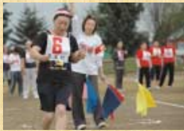
▲「運命のミラクルボックス」