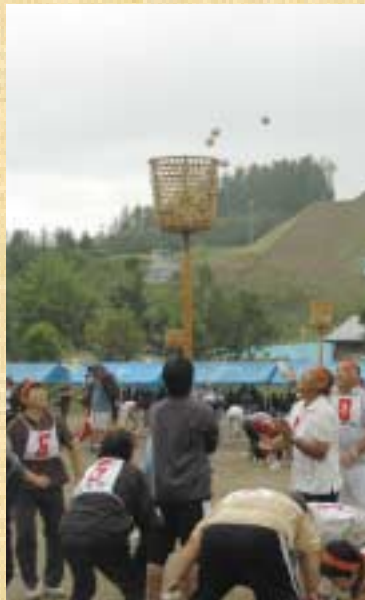
▲雨の中での「玉入れ」