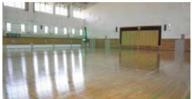
▲床を全面張り替えたアリーナ（大体育館）