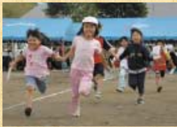
▲仲良くゴール「札合わせ」