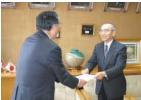
▶9月29日、教重会長(右)から山口町長(左)に、行政評価報告書が手渡されました。