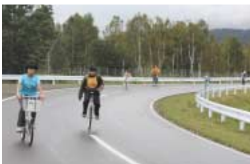
▲一輪車等でテストコースを走る参加者

ウォーキングや一輪車タイムトライアル。町内のスバル車所有者が自分の車でテストコースを運転する走行体験のほか昼食交流会などが行われ、参加者たちは普段立ち入ることのできない