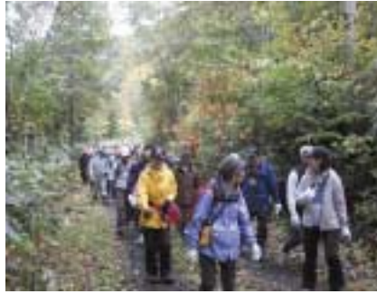
▲ウォーキングを楽しむ参加者

昼食を早々に切り上げ下山し、大パノラマの絶景は次回に持ち越しになりましたが、悪天の中でも参加者たちは、函岳の大自然を満喫し、秋の一日を楽しみました。