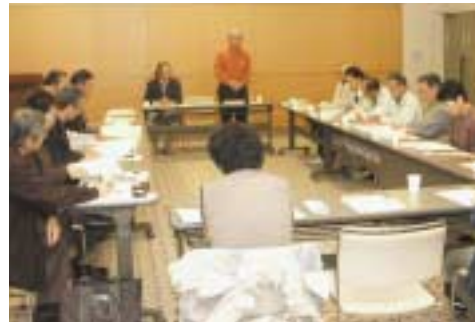
▲地域住民有志で発足した実行委員会

地域住民有志で構成する第4回国際樹液サミット2010実行委員会の発会式が10月1日文化会館で行われました。