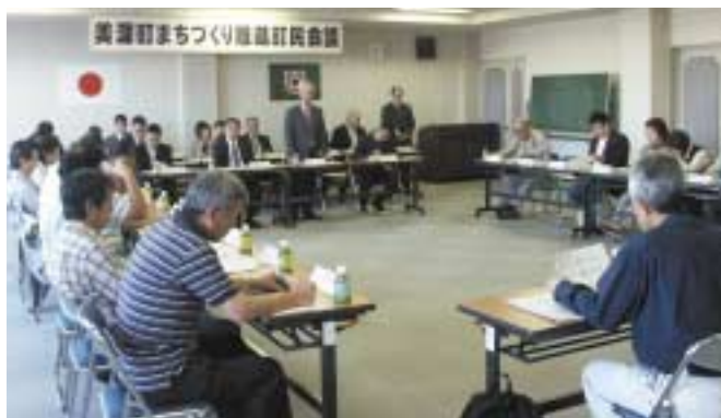
▲町政全般について活発な意見交換が行われた町民会議

同会議は、町内各団体や自治会からの推薦委員、公募委員の30名で構成される住民組織で任期は3年。町の主要課題や施策の推