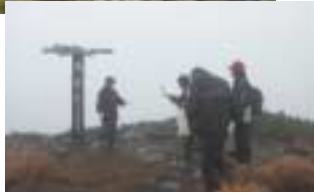
▲山頂は霧で真っ白