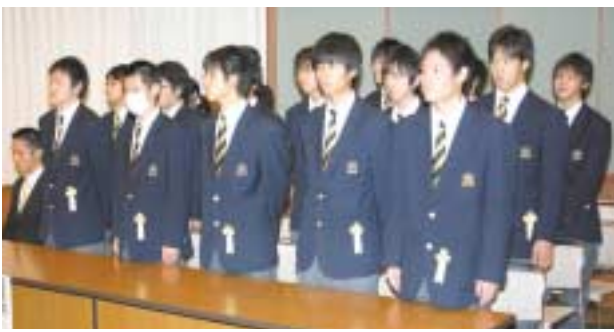
▲奨励賞を受賞した美深高校サッカー部の皆さん

また、団体の部で受賞した美深高等学校サッカー部は、小規模校における不利を並々ならぬ努力によって克服し、本年は全国高校総体北海道予選会に出場。さ