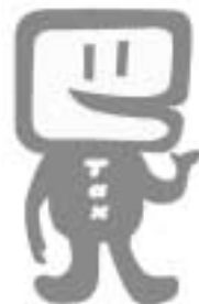
イメージキャラクター「イータ君」