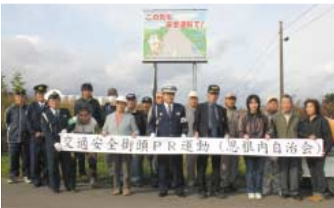
▲大手地区に設置された交通安全PR看板

恩根内自治会は、国道40号が縦貫し、交通量も多く、過去には死亡事故も発生している地域。今回の看板設置は、自治会内で悲惨な交