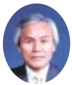
長 勇 岡 副 諸 議 長

ありました。 有権者の多くは、盛り上がり不足で、行財政の厳しさに対応できるか、地方自治充実・自治能力の向上など、地方分権を支えるための、市町村合併の目的にも、判断を下せるのか、合併