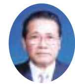
長 雄 園 部 議 長