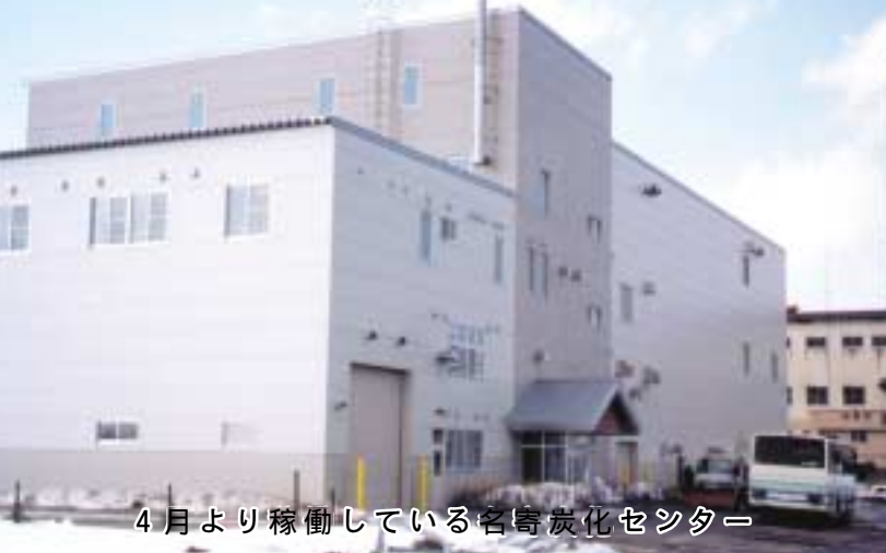
4月より稼働している名寄炭化センター