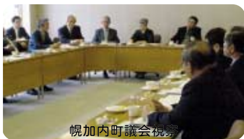
幌加内町議会視察

調査事項 ・地域振興策の実情、 取り組みについて ・議会活性化の取り組 みについて。