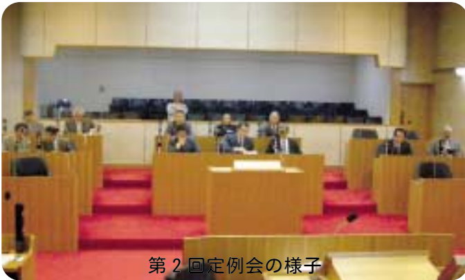
第2回定例会の様子