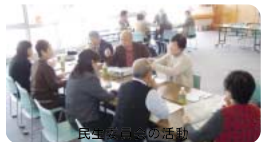
民生委員会の活動

質問 民生委員は、本年11月に改選となるが地域に根ざした活動が求められる仕事であり、今後の高齢化を考えれば定数の増あるいは待遇の向上、サポート体制を充実すべきではないか。