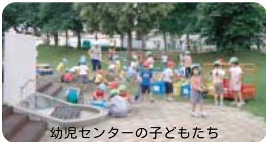
幼児センターの子どもたち

町長 内容は承知をしており、話を聞かされた時戸惑いも感じたが、難しい問題とされている。子育て支援について、重視する基本的な考えがあり、見極めとまとめに少し時間がほしい。