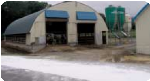
消石灰の散布で口蹄疫対策

今、町としては各所に防疫マット、農家の出入り口に消石灰の散布をお願いして進入防止を徹底している。