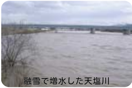
融雪で増水した天塩川

活性化促進補助金の追加、公用車の購入費、公務災害見舞金の追加、地域観光サポートビジネス実証事業の委託費用の追加、口蹄疫予防対策経費と仁宇布地区給水施設の漏水調査等にかかる費用、地域新