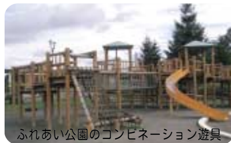
ふれあい公園のコンビネーション遊具

質問 幼児センター管理費、仁宇布地区では幼児センター並みの子育てをしようとしている、経費等の考えは。