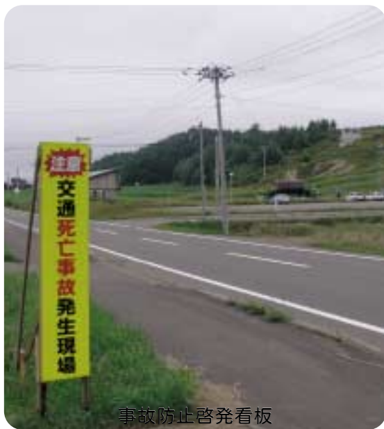
事故防止啓発看板