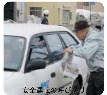
安全運転の呼びかけ

3月11日に発生した 死亡事故を教訓に二度 と事故を起こさないた めにも全職員に安全運 転の意識高揚の方策を 講ずべきである。