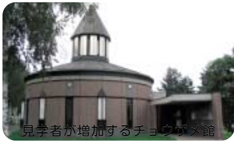
見学者が増加するチョウザメ館