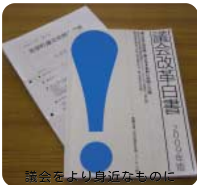
議会をより身近なものに

議会傍聴者への資料 提供に持ち帰りは認め ないが定例会、臨時会 に提供することで町理 事者協議を進めている。