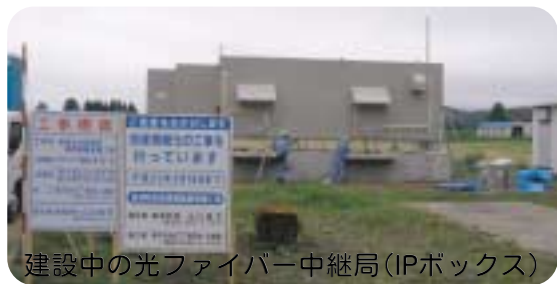
建設中の光ファイバー中継局(IPボックス)

総務課長 町内業者で対応できる工事として配電盤の設置、配電工事等が期待できる。また、端末機の故障等が起きた場合は町費