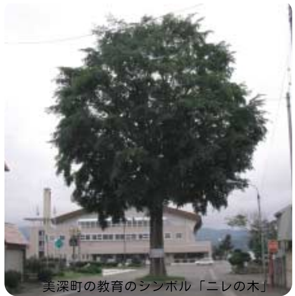
美深町の教育のシンボル「ニレの木」