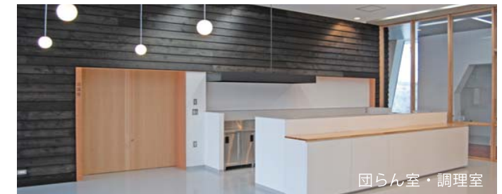
団らん室・調理室