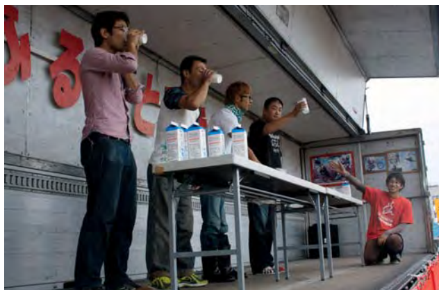
牛乳早飲み大会に挑戦する参加者たち

美深ふるさと秋まつり(美深町観光協会主催)が9月4日、町民体育館横イベント広場で開催されました。あいにくの雨模様でしたが、会場では、ジャガイモやカボチャなどの新鮮野菜や美深牛丸焼きなど地場産食材が販売されたほか、美深産小麦「ハルユタカ」ラーメン早食い大会や牛乳早飲み大会などのイベントも行われ、たくさんの町民たちが訪れ、秋の味覚を満喫しました。