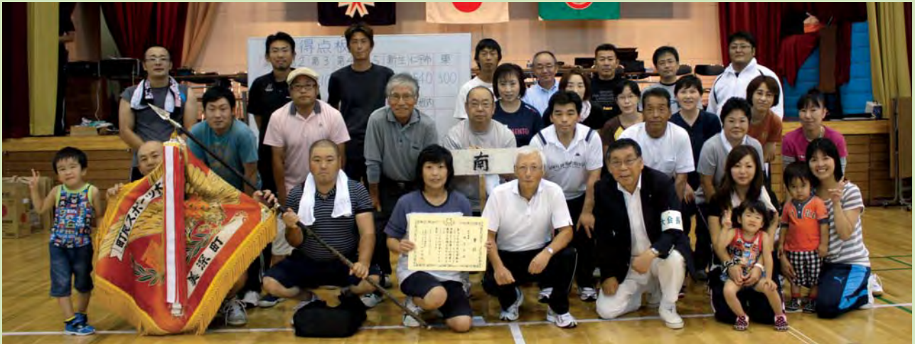
見事優勝に輝いた南自治会のみなさん！