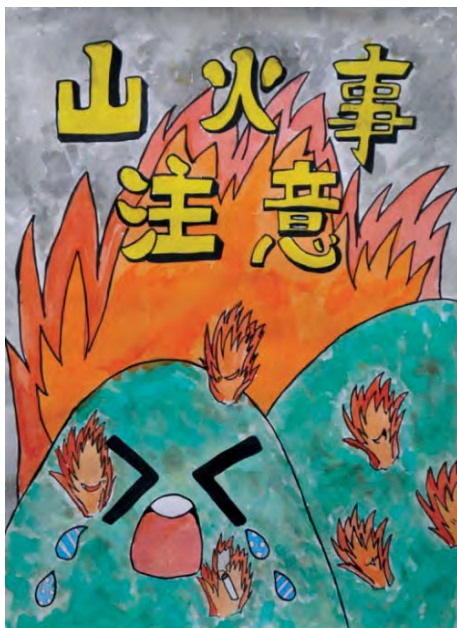
平成26年度林野火災予防に関する作品 最優秀賞 吉田芽生さん(美深小学校6年生)