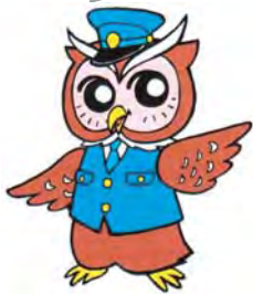
「ミマモロウ」 美深警察署 オリジナルキャラクター

美深警察署 TEL・防災情報端末機 2・1110 少年相談110番 0120・677・110 警察相談電話 0166・34・9110または#9110