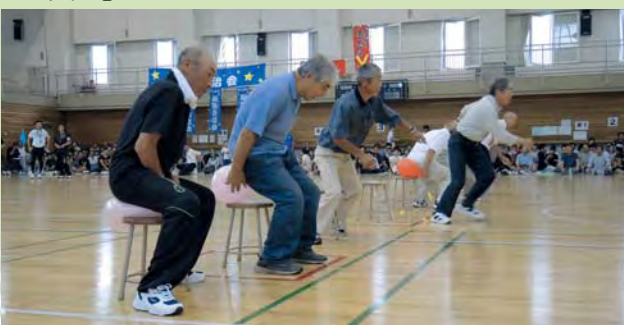
風船を割る「血圧測定」