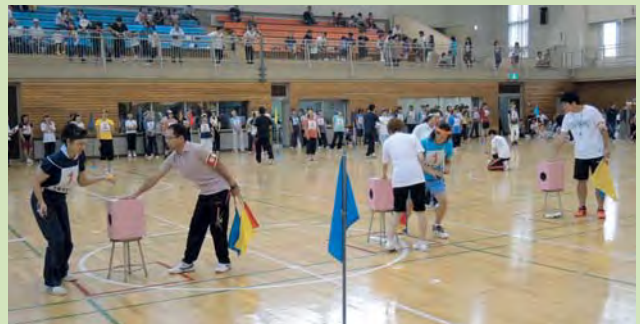
「運命のミラクルボックス」