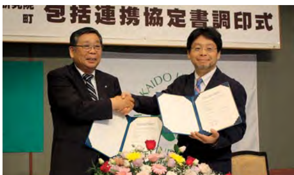
握手を交わす山口町長と安井研究院長(右)