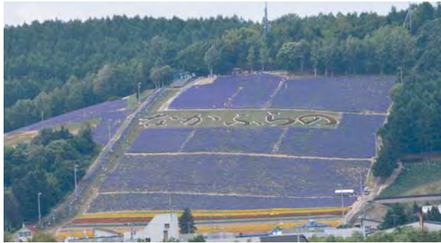
中富良野町スキー場のラベンダー畑

会社が買い取っていたため、ラベンダー栽培も安定した経営ができていました。しかし、昭和50年代から安い輸入品に押されるようになり、香料会社によるラベンダー油の買い取りも中止。