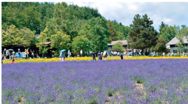
観光客でにぎわう「ファーム富田」のラベンダー畑

なかなか撤退できずにいた「ファーム富田」では、収入の得られないラベンダー栽培を継続することは難し