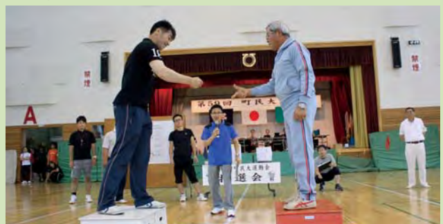
「自治会対抗じゃんけん大会」