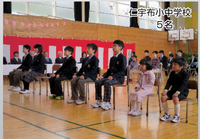
仁宇布小中学校 5名