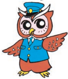
「ミマモロウ」 美深警察署 オリジナルキャラクター

期間中は、自治体、教育委員会、事業者などの関係機関・団体や地域住民と一層連携し、住民の自主防犯意識の高揚と各地の地域安全活動の活性化を図り、犯罪のない安全で安心して暮らせる地域社会の実現を目指します。