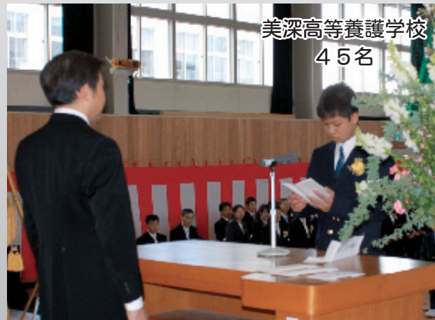
美深高等養護学校 45名