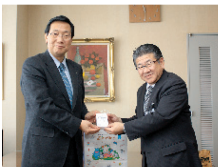
北星信用金庫美深支店の深川支店長(右)

○生活協同組合コープ札幌 交通安全ランドセルカバー 30枚 ○日本マクドナルド(株) 防犯笛 40個 ○北星信用金庫美深支店 防犯ブザー 30個