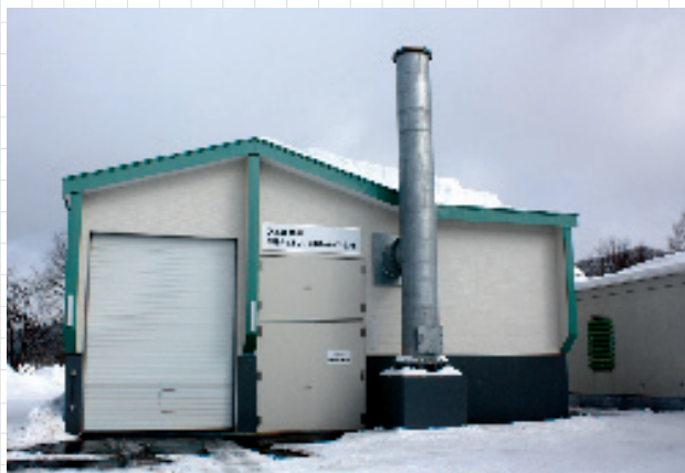
びふか温泉の木質バイオマスエネルギープラント