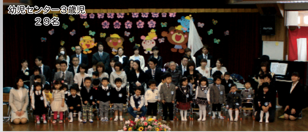
幼児センター3歳児 29名