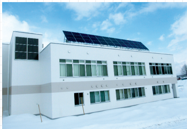
美深中学校に設置したの太陽光パネル

次号から毎月の二酸化炭素排出削減量を掲載していきますので、わが町の環境保全の取組について、みんなで考えていきましょう。