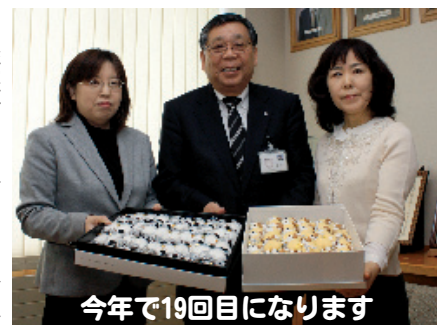
今年で19回目になります

○美深町に(3月受付分) ○まちづくり応援基金寄付 1件：1万円 ●社会福祉協議会愛情銀行に (3月受付分) ○手芸品販売益金 呼布の会 8千147円