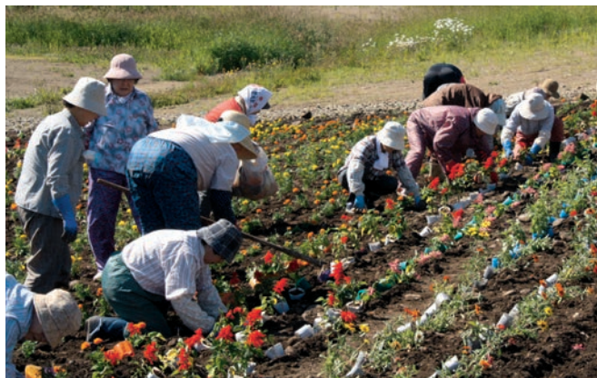
色とりどりに植栽する参加者たち