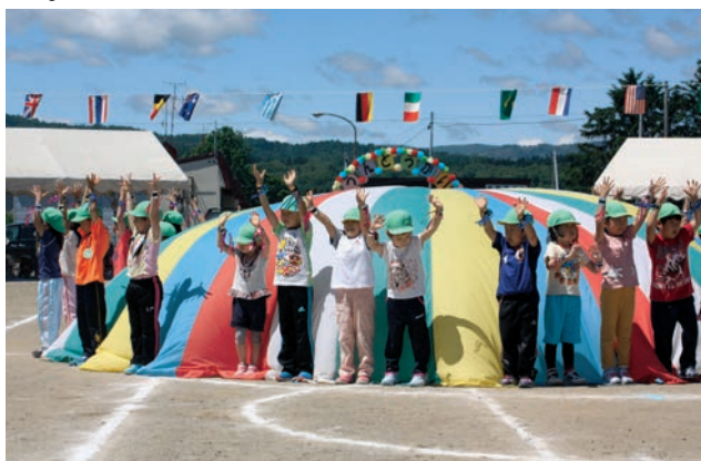
バルーン演技を披露する園児たち

快晴となった6月20日、幼児センターで運動会が行われました。運動会では、跳び箱や平均台などの障害物乗り越えてゴールを目指す障害物競走や保護者と一緒に参加する競技など、楽しい種目が行なわれました。会場には、たくさんの家族が応援に駆けつけて、大きな声援を送り、園児たちもその声援を受けて、元気いっぱい一生懸命走ったり、踊ったり大活躍でした。