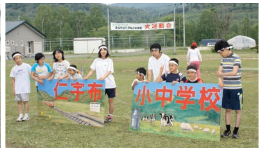
「祝開校100周年」「仁宇布小中学校」の看板を掲げる児童生徒たち