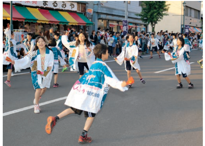
よっちゃんを披露する美深小学校「北の魂」

商店街の夏の夜まつり「びふか夜市」が6月19日、駅前通りと町道8線通りの歩行者天国をはじめ、緑町、日の出町、旭町、双葉会の各商店街会場で行われました。好天に恵まれたこの日は、各会場で焼き鳥やドーナツ、生ビールなどの模擬店やJA女性部の野菜販売のほか、ダーツやビンゴ大会、千円抽選会などの催しも行われました。メインイベントのよさこいソーランは、美深小学校3～5年生の児童による「北の魂」、のぞみ学園のメンバーで構成する「美深あっぱれ隊」が元気の踊りを披露し、沿道の観客から大きな拍手が送られました。