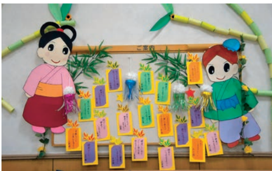
七夕に作成した作品です