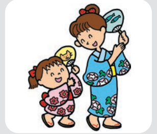
美深ふるさと 子供盆踊り 8月13日

ただし、8月15日以後から贈呈の日(敬老会の日)までに死亡または転出した際は祝品を贈呈できません。 ■問合せ先 保健福祉課 保健福祉グループ福祉係 TEL・防炎情報端末機2・1683