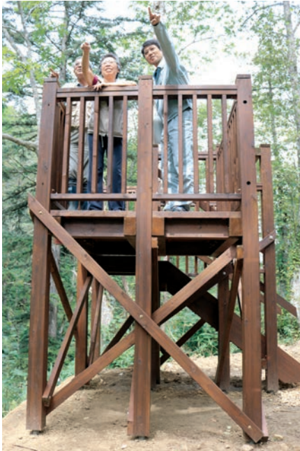
新しい展望台から「激流の滝」を望む観光客

階段状の落差が5㍍ある「激流の滝」(字仁宇布)に、木製展望台を設置され、地上1.8㍍の高さから、勢いよく流れる滝が安全に眺められます。展望台は、防腐処理した上川北部産トドマツ材を使用。基礎部分に金属を組み合わせた木製ハイブリッド工法を採用し、床面も腐食しにくく、耐久性に優れています。滝めぐりツアーでも1番人気だった観光スポットで、たくさんの方の来観者をお待ちしています。