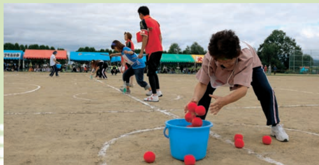
第60回記念大会競技「みんなでもひろい&ピンつりりれー」