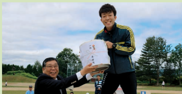
「自治会対抗じゃんけん大会」 第1位【第4自治会】