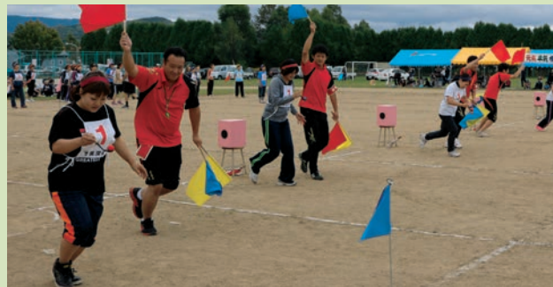
「運命のミラクルボックス」

4年ぶりの晴天に恵まれ、各自治会が総力を挙げて熱戦が繰り広げられた町民大運動会。子どもからお年寄りまでたくさんの町民が参加し、地域のきずなを深めました。(8月23日・美深小学校グラウンド) ※各自治会の成績は「生涯学習だよりピウカ」に掲載しています