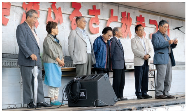
札幌美深会ふるさと訪問のみなさん