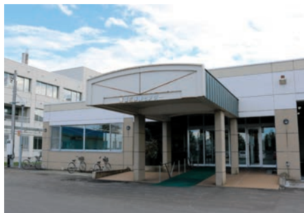
美深町保健センター

また、運動の目標を立てる際のご相談もお受けしています。ぜひ、この機会にご利用ください。