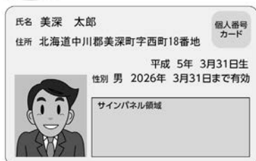
個人番号カード【表面】