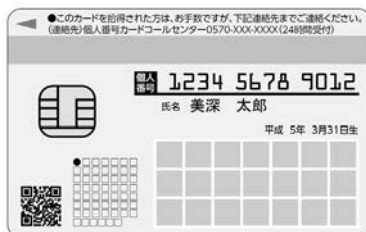
個人番号カード【裏面】

申請から受け取りまで役場に1回の来庁で受け取れます。申請は、通知カードと一緒に届く申請書に写真を添えて申し込みをします。同封の書類に記載のホームページからも写真データを添えて申請できます。また、役場でも交付申請受付を予定しています。