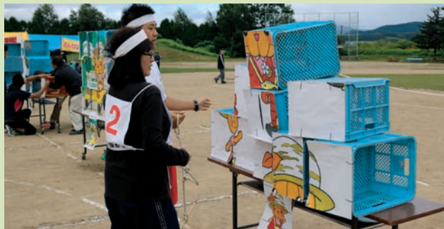
新競技「宅急便リレー」