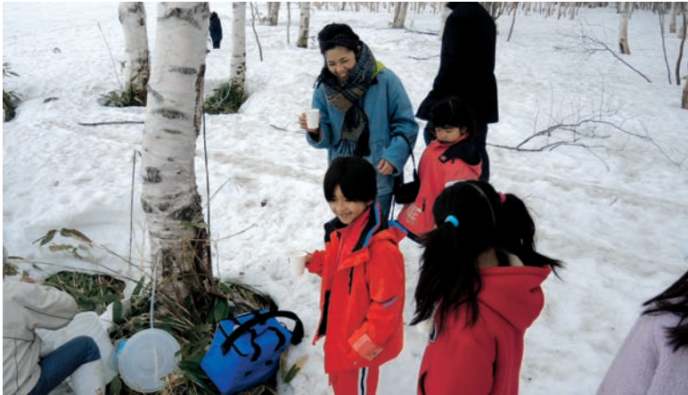
新鮮な白樺樹液を楽しむ参加者(上)と カムイノミ(下)