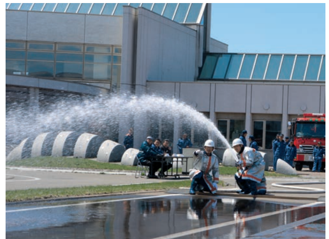
迅速な消化に備えた小型ポンプ実践操法