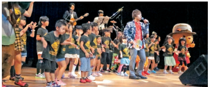
ODSmoversと共演し、会場を沸かせました