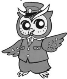
「ミマモロウ」 美深警察署 オリジナルキャラクター