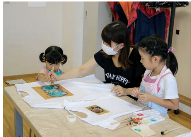
親子で楽しくオリジナルTシャツを作りました