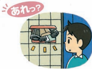
郵便物や新聞が郵便受けにたまっている