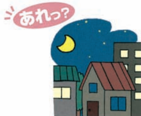
夜になってもし家に明かりがつかない