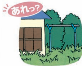
庭の手入れがされなくなったり、洗濯物が干されなくなった