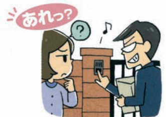
見慣れない人が家に入出入りするようになった