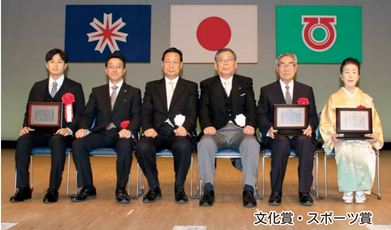
文化賞・スポーツ賞