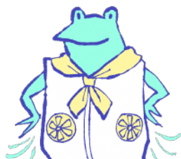
ファン付きウェア、 ネッククーラー