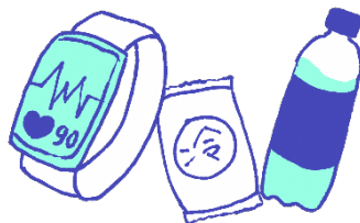
ウェアラブル端末、 応急セット