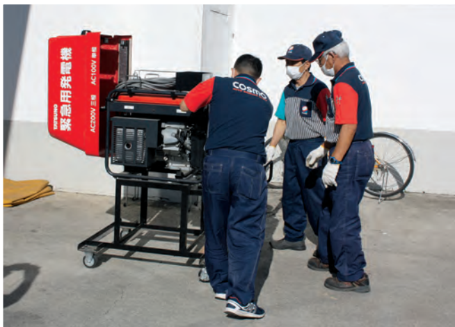
緊急用発電機の稼働を確認し電源確保 ㈱園部商会

上川北部地方石油業協同組合の災害時対応一斉訓練が行われ、町内では㈱園部商会と㈱馬場商店のSSで実施されました。過去の甚大な被害を忘れないためにも、胆振東部地震発生日である9月6日に、時刻は東日本大震災発生時刻の午後2時46分に合わせて行われました。同組合では、胆振東部地震で発生した「ブラックアウト」以降、加入店全店で緊急用発電機を導入しており、訓練では、災害発生時の安全確保と発電機の稼働、関係機関への報告など一連の作業のほか、町と締結した「災害時燃料等提供に関する協定」に基づき、緊急車両への給油をスムーズに行うための動線を設けるなど、災害時の対応を確認していました。