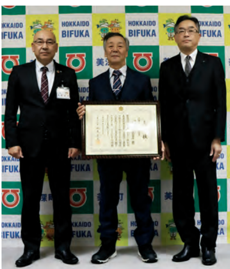
左から草野町長、橋本理事長、喜多北部森林室室長