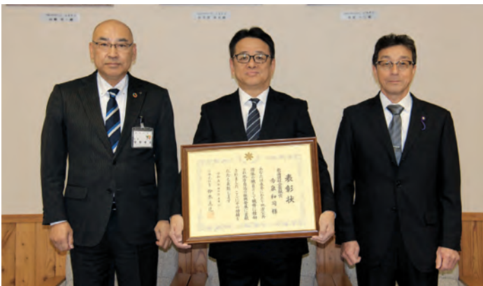
左から草野町長、今泉前副町長、南議長

てきた。町民の皆さま、議会、職員のご協力があったからこそこの受賞。たくさんの思い出があり、今回表彰をいただき嬉しく思う。今後は、地域や自治会活動に貢献したい。後輩から要請があればいろいろな分野、場面で力になればと思う」と感謝と今後について述べられました。