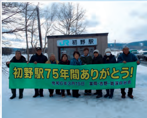
富岡自治会のみなさん