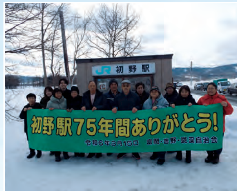
斑溪自治会のみなさん