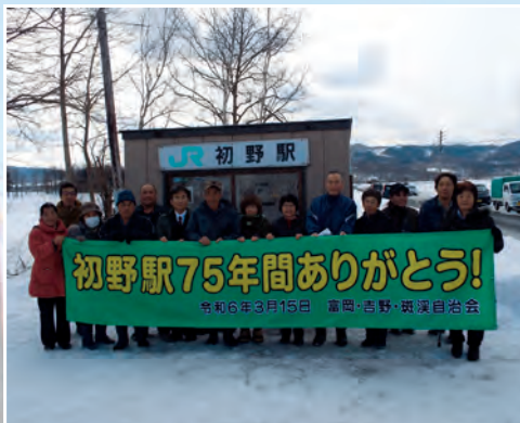
吉野自治会のみなさん