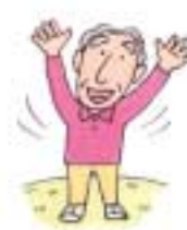
ストレスをためない生活を