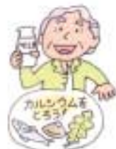
カルシウムを多くとろう