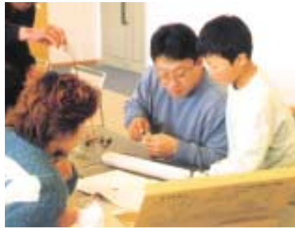
親子で協力して作りあげました

れあい講座」が2月28、29日の2日間、文化会館CO M100で開催されました。この講座には、町内の5組の親子が参加し、ハンダごてを使っての配線作業やドライバーを使っての組み立て作業に悪戦苦闘していましたが、親子で相談しながら、無事すべての親子が電気スタンドを完成させました。