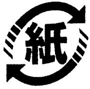
紙製容器 包装マーク