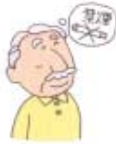
アルコールやたばこはひかえめに

骨粗しょう症とは骨のカルシウム分が減り、骨の質があらくなってしま病気です。転んで手をついたり、尻もちをついたりするだけで骨折してしまうことがあります。