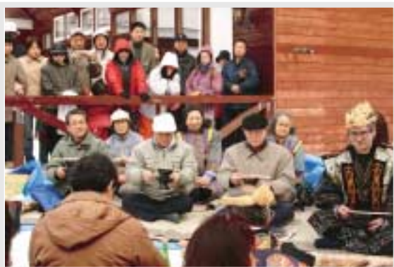
◀森の神様に感謝「カムイノミ」

今年も道内外から多くの人々が訪れ、樹液採取体験などを楽しみながら自然の恵みいっぱいの「春の樹液」を堪能しました。