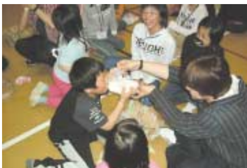
▲アイス作りを体験する子どもたち

この事業は、青少年の健全育成と地域の子育て支援のために実施しているもので、今年度は小学2年生から中学3年生までの47名の小中学生が参加しました。