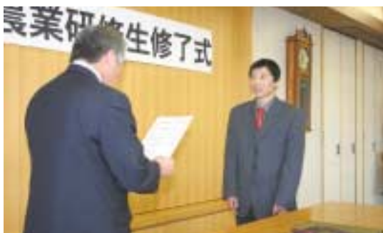
▲修了証書を受ける中国人留学生

修了式には、受け入れ農家、農協など各関係者が出席し、あいさつに立った木下組合長は、「研修も3年目を迎え、農業技術の相互研さんはもとより国際交流