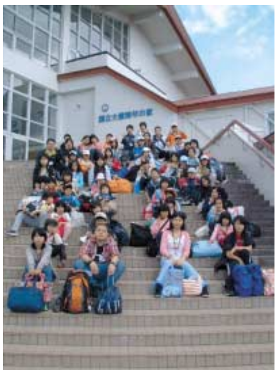
▲子ども教室に参加した小中学生たち

大雪青年の家に到着した小中学生は少し緊張ぎみでしたが、大雪青年の家の職員からレクリエーションゲームを教わると、子どもたちは歓声を上げながらゲームを楽しみ、すぐに打ち解けた雰囲気となりました。 1日目の夜の研修では、アイスクリーム作りを体験。大雪ボランティアサークルのメンバーから、雪や新聞紙など身近な素材を使ったアイスクリーム作りを体験し、科学の不思議さとアイスクリームの甘さ、それに仲間と共有した楽しい時間は、小中学生に忘れられない思い出を残したでしょう。