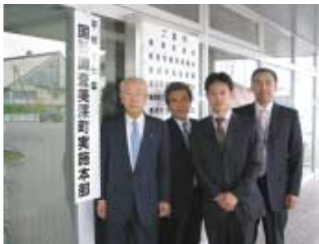
▶5月27日(金)に平成17年国勢調査実施本部を設置しました。

記入された内容は、統計法によって厳重に守られ、他に漏れたり、統計を作成する以外の目的に使われることは、絶対ありませんので、未来のために、あなたの現在を調査票に記入してください。