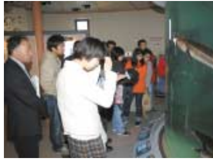
▲チョウザメ館を訪問した新町民のみなさん

町と美深郵便局との共催による平成17年度施設見学会が、5月14日に開催されました。