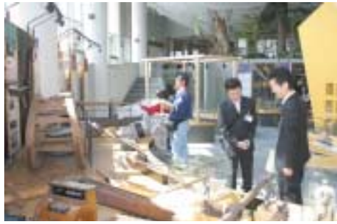
▲郷土資料室を見学する参加者たち

町と美深郵便局との共催による平成18年度施設見学会が、5月20日に行われ、道内外から転入してきた20人が参加しました。