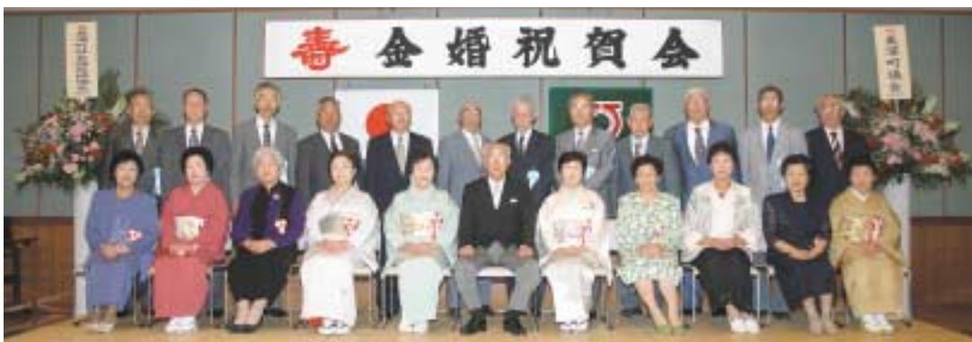
▶この日の祝賀会には、12組22人のご夫婦が出席しました。

今後は道教委、道議会の動向を見ながら、高校の存続に向けて、引き続き運動を展開していきます。