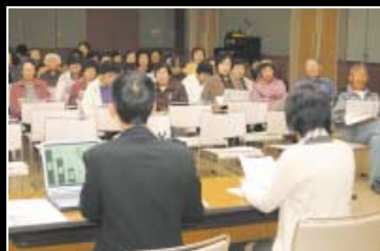
▲10月に開催した税制改正などの説明会