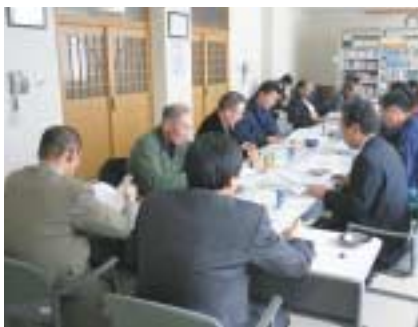
▲地域の防災について協議した研修会

今後これらの検討課題については、自治会長らが集まる自治会連合会の役員会などの場で協議されます。