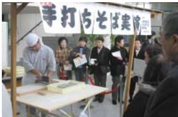
▲名寄地区そば打ち愛好会の協力で手打ちそばの実演も