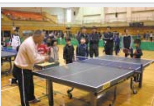
▲親子で八種類の種目に挑戦した近代八種競技