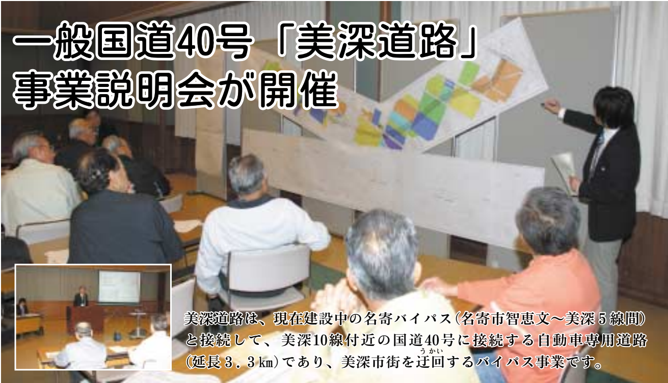
美深道路は、現在建設中の名寄バイパス(名寄市智恵文～美深5線間)と接続して、美深10線付近の国道40号に接続する自動車専用道路(延長3.3km)であり、美深市街を迂回するバイパス事業です。