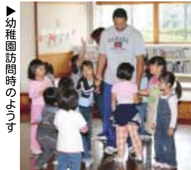
▶幼稚園訪問時のようす

をしていきたい。」と意気込みを話してくれました。また、学校以外では「イベントに参加したり、スポーツを通じて町の皆さんと交流していきたいです。」と話してくれました。