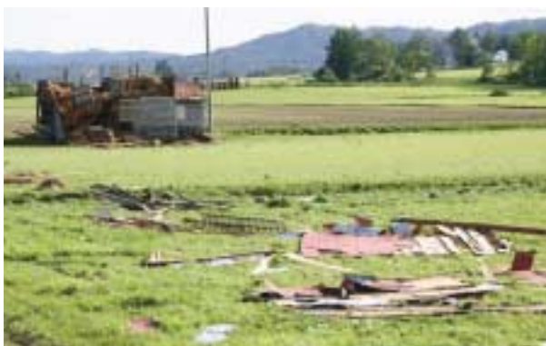
▲丸ごと飛ばされ畑に散らばった納屋の屋根