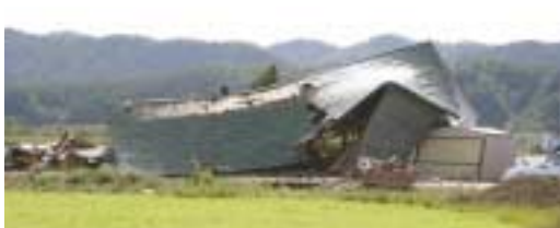
▲▼大きな納屋にも被害がでました