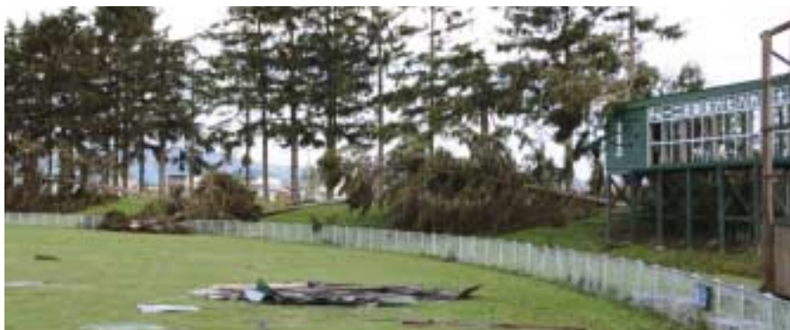
▲中学校グラウンドと町営球場の大きな木も30本以上倒されました。