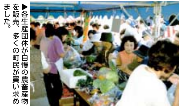
▶各生産団体が自慢の農畜産物を販売、多くの町民が買い求めました。

町観光協会主催による第20回美深ふるさと秋まつりが9月4日に開催され、多くの町民が会場を訪れ、多彩なイベントや試食、買い物などを楽しみ、実りの秋を満喫しました。