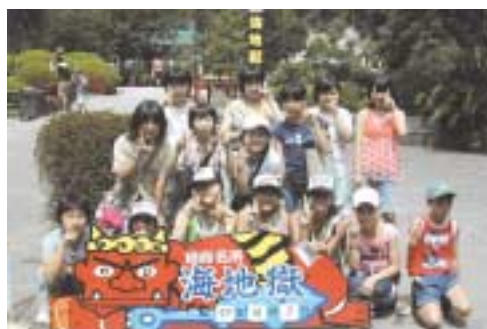
▲別府名所「海地獄」で記念撮影