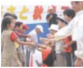
▲豪華景品をかけた「じゃんけん大会」は、子供も大人も真剣。

めには、衛生管理が最重要である。」と話し、さらに主に道外に出荷されている美深牛を地元でも出回るようにするためには、「消費者である町民が中心となって仕組みづくりの確立とPRが大切である。」と参加者に呼び掛けました。 第2部の実食バイキングでは、美深出身で現在は札幌市で料理店を営む南雅二さんをシェフに招き、サイコロステーキなど「美深牛」をメインに13品の料理が並び、参加者たちは美深産の牛肉の味を堪能しました。