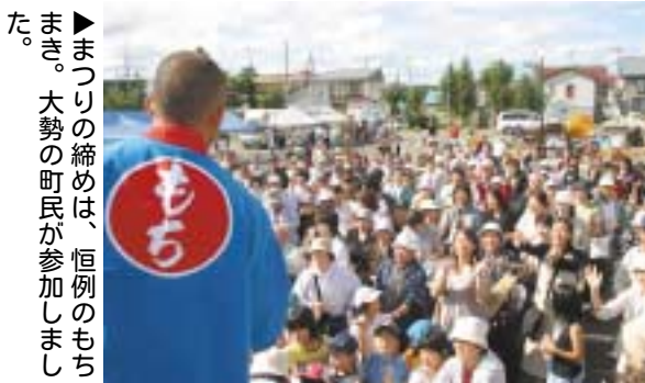
▶まつりの締めは、恒例のもちまき。大勢の町民が参加しました。

町観光協会主催による第21回美深ふるさと秋まつりが9月4日に開催され、多くの町民が会場を訪れ、多彩なイベントや試食などを楽しみ、実り秋を満喫しました。