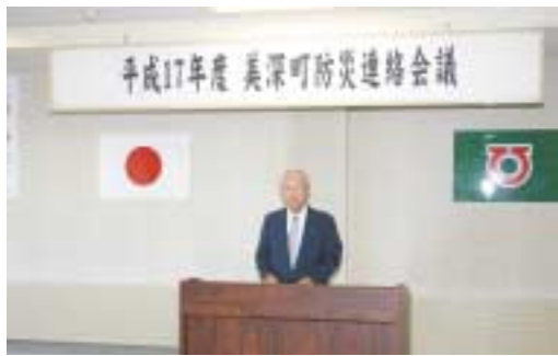
▲防災意識の高揚を呼び掛ける岩木町長

町内各関係機関と自治会による町防災連絡会議が8月30日町役場で開かれ、災害時の組織や連絡体制、災害対応などについて情報交換を行いました。 会議の冒頭、岩木町長は「昨年の台風災害を踏まえ、年に1回は町の防災計画がどういうものか、情報交換しながら意識を高めていくことが大切。災害が起きたときは、関係団体、自治会、