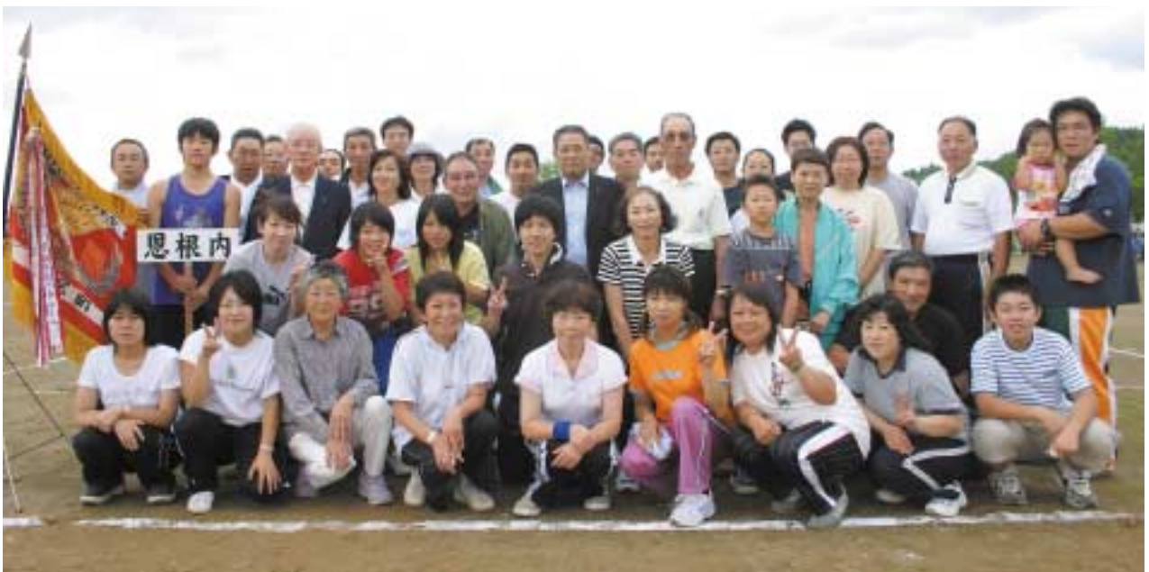
▲記念すべき第50回の町民大運動会を制した恩根内自治会