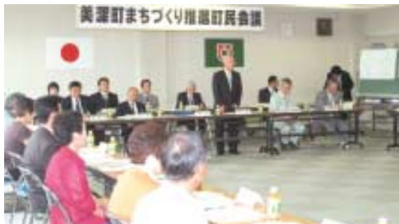
▲今回から町政モニターの役割も担うことになった町民会議