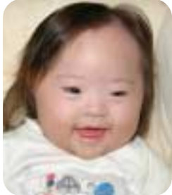
○明るく元気に育ってください …(父・母)。