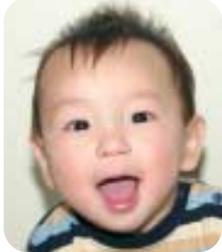
○元気に育ってね…(父・母)。