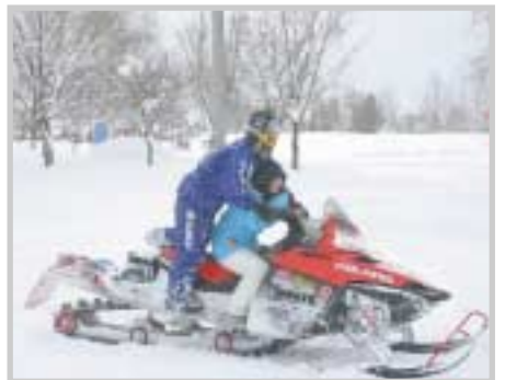
▶子供たちに大人気だったスノーモービル体験