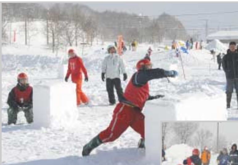
▲今年も熱戦が繰り広げられた雪合戦大会。男女合わせて10チームが参加しました