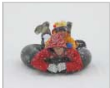
◀親子で真剣でしたチューブカーリグの方は、子どもよりも親