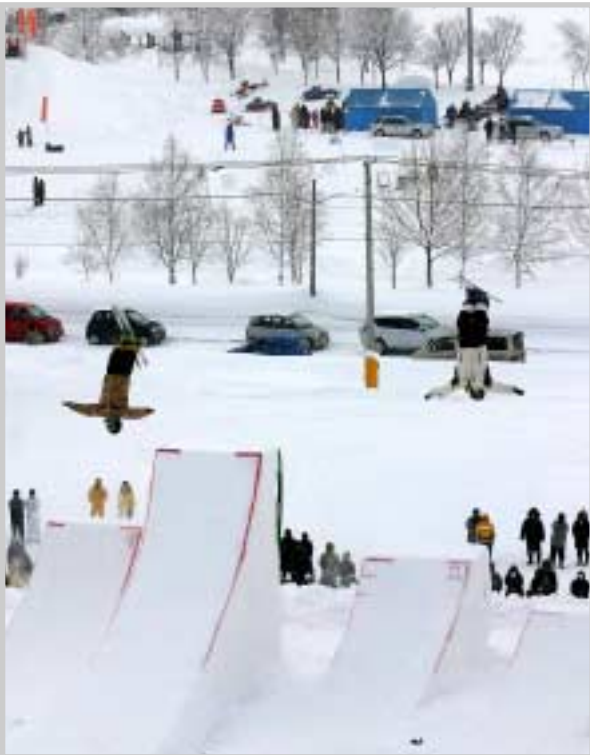
▲宙返りなど華麗な空中演技の数々に圧巻したエアリアルショー。3月には、町長杯や北海道選手権などエアリアル大会が美深を会場に開催されます

「ウィンターフェスタ'06」が2月12日、運動広場とスキー場を会場に行われました。今年は北海道スキー連盟のフリースタイルスキーチームがウィンターフェスタに合わせて合宿を行い、華麗な空中演技を披露。またメイン会場では、雪合戦をはじめさまざまなイベントが催され、会場は多くの町民でにぎわい、寒さを忘れて冬ならではのイベントを満喫しました。