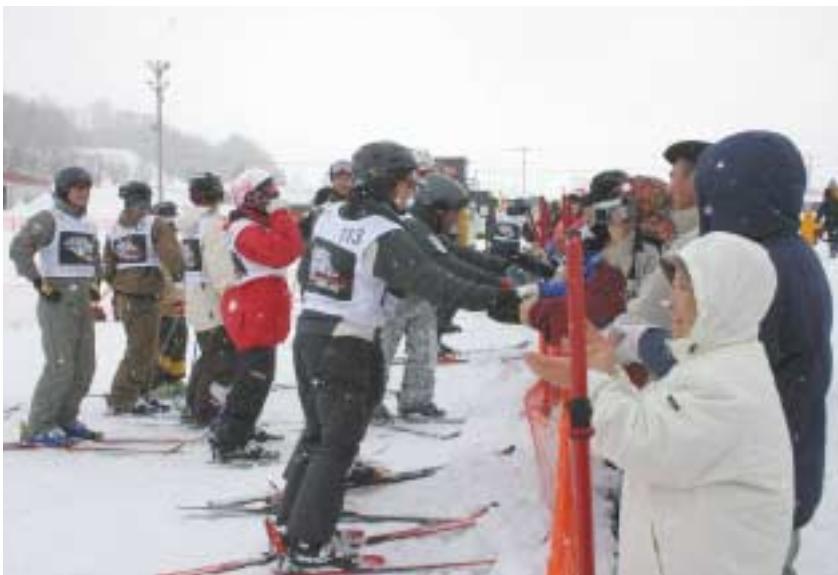
▼演技終了後に、選手たちが訪れた観客とふれあう場面もありました。

3月11・12日の2日間にわたり盛大に開催されたエアリアル大会。 道北で初めての大会に訪れた観客は大興奮！その大会の様様を写真でお伝えします。