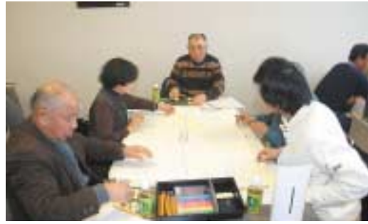
▲災害時の行動についてグループで意見交換

日常の防災に対する意識の向上を図ることを目的とした防災研修会が3月4日文化会館COM100で行われました。