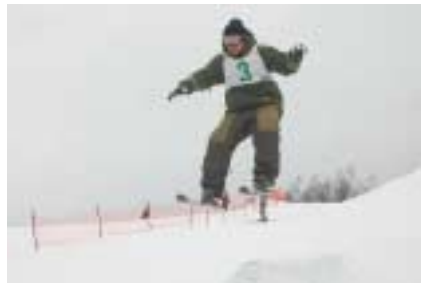
▲町長杯では特設ジャンプ台を使い、町内の子どもたち20人と一般参加者たちがジャンプに挑戦しました！