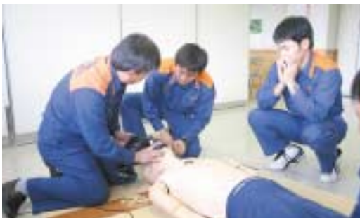
▲真剣に実技研修に取り組む参加者たち

講演では、「トリアージ」と呼ばれる災害医療で多数の傷病者を重傷度と緊急性によって分別する正しい方法や「AED（電気ショック機器）」の重要性と普及させるために必要なことな