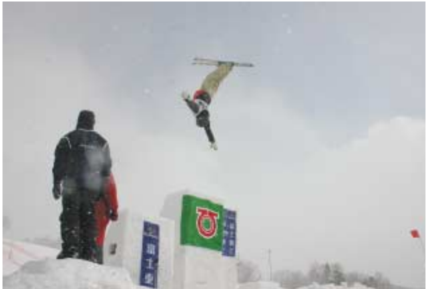
▲トリノオリンピックに出場した水野剣選手や逸見佳代選手らが華麗な演技を次々に披露！