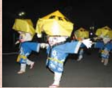
▲メインイベントのあんどん行列。見事なあんどんが夏の夜空に美しく彩りを添え、沿道の観客を楽しませました