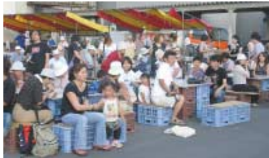
▲たくさんの町民で賑わいをみせた「ふれステ祭」

旭町ふれあいステーションの利用促進と商店街の活性化、さらには、地場産品の消費拡大を図ろうと旭町商店会主催の「ふれステ祭」が8月5日、同所を会場に行われました。