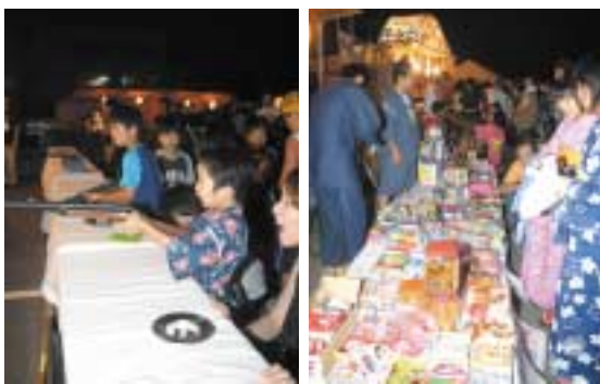
▲射的などの楽しい夜店に子どもたちは大興奮

美深町観光協会が主催するふるさと子供盆踊り大会が8月13・14日に行われました。会場には色とりどりの浴衣を着た子どもたちが家族とともに大集合。やぐらを囲んで、大きな輪をつくり楽しそうに踊っていました。