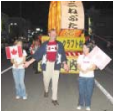
▶あんどん行列では、町民たちと一緒に町内を行進しました

24、25日の夏まつりでは、あんどん行列や夏一夜の夕べに参加して、町民たちと交流を図り、友好の絆をより一層深めました。