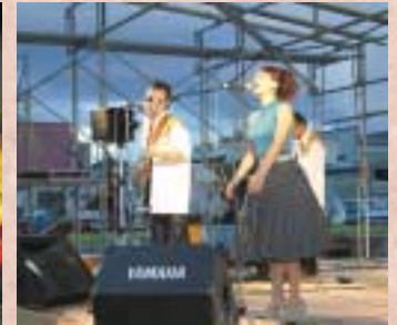
▲夏一夜の夕べでは、ゴリエンジェルダンサーズやヨサコイ演舞に大興奮