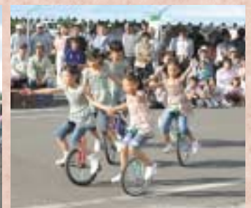
▲おまつり会場では、全町ビンゴ勝ち抜き大会や青空発表会など多彩なイベントが催されました